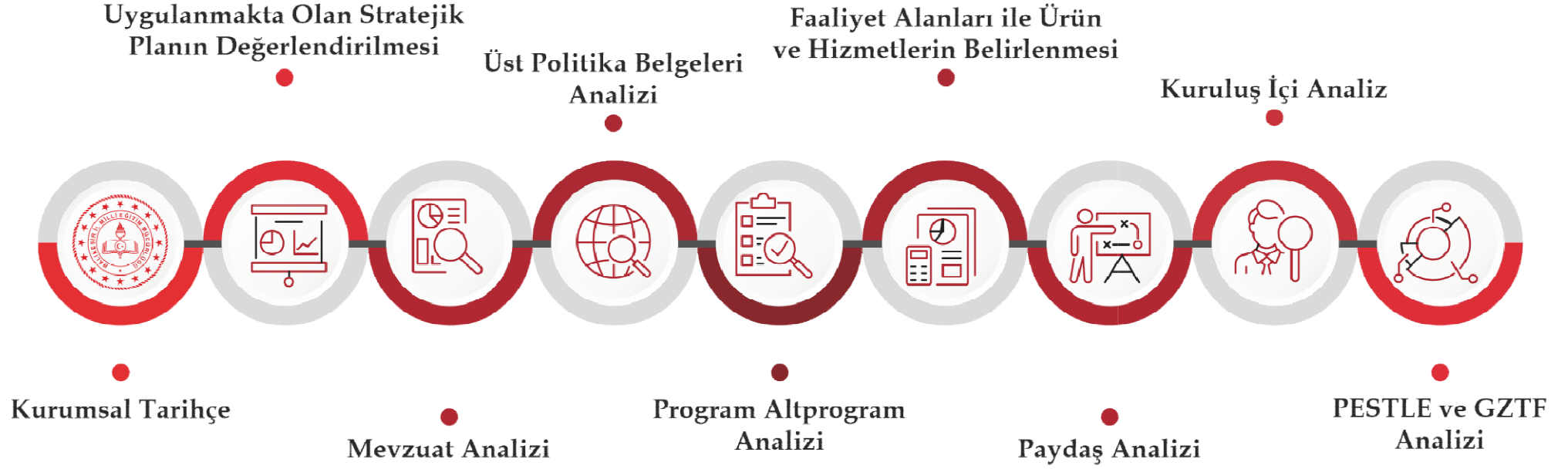
Şekil 2.Durum Analizi