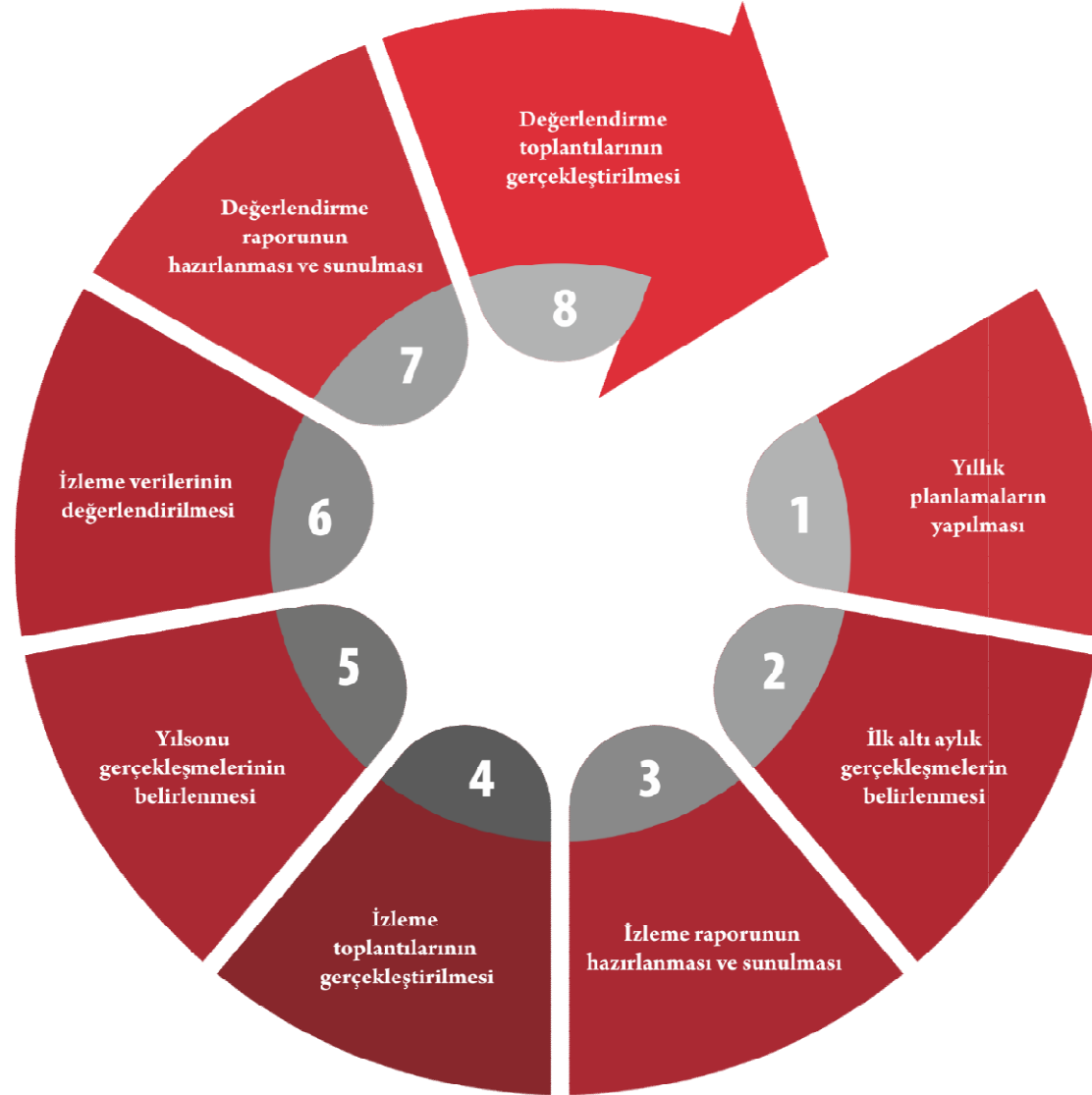
Şekil 4. İzleme Değerlendirme Süreci