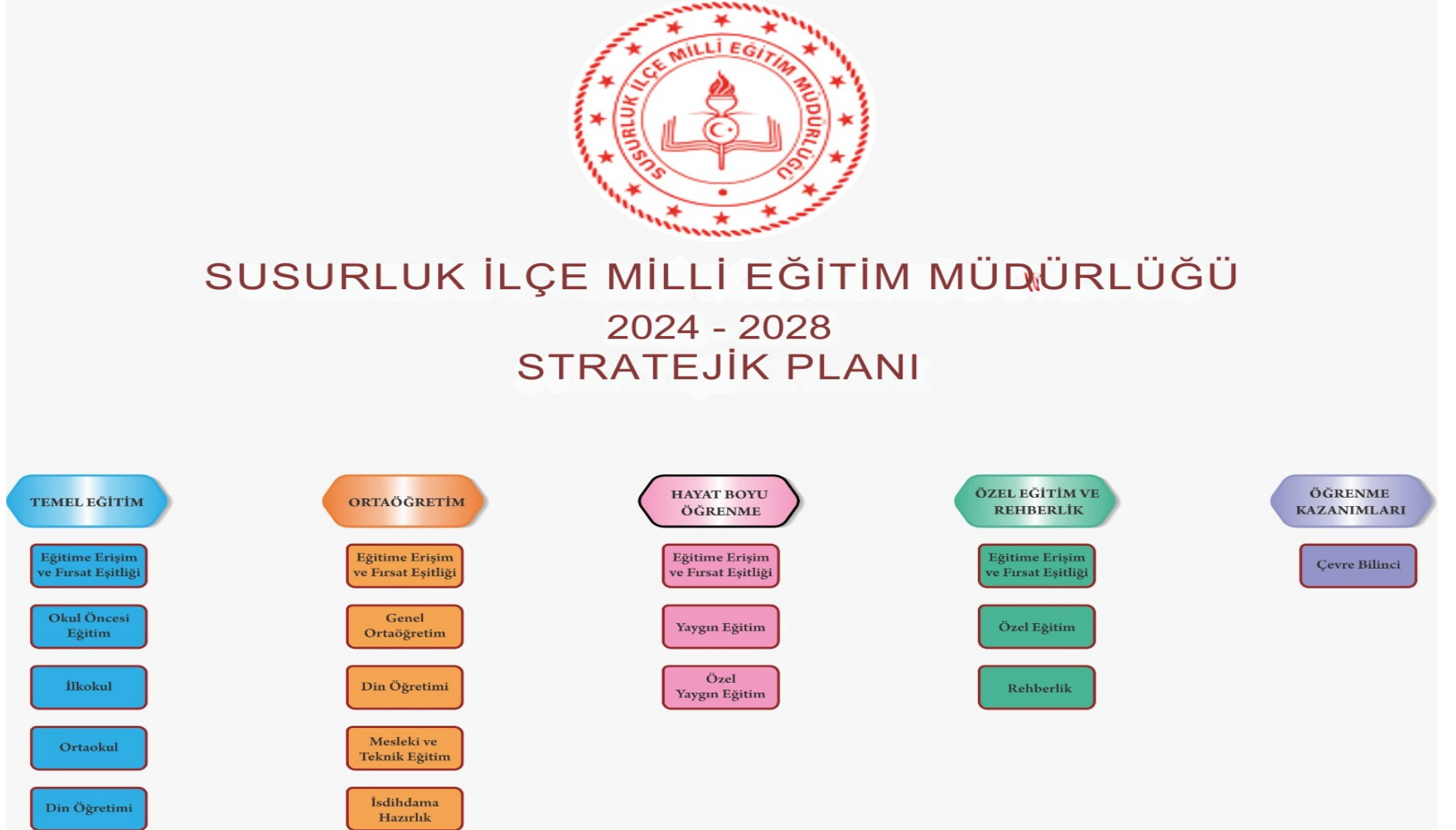
Şekil 3. Susurluk İlçe Millî Eğitim Müdürlüğü 2024-2028 Stratejik Plan Diyagramı