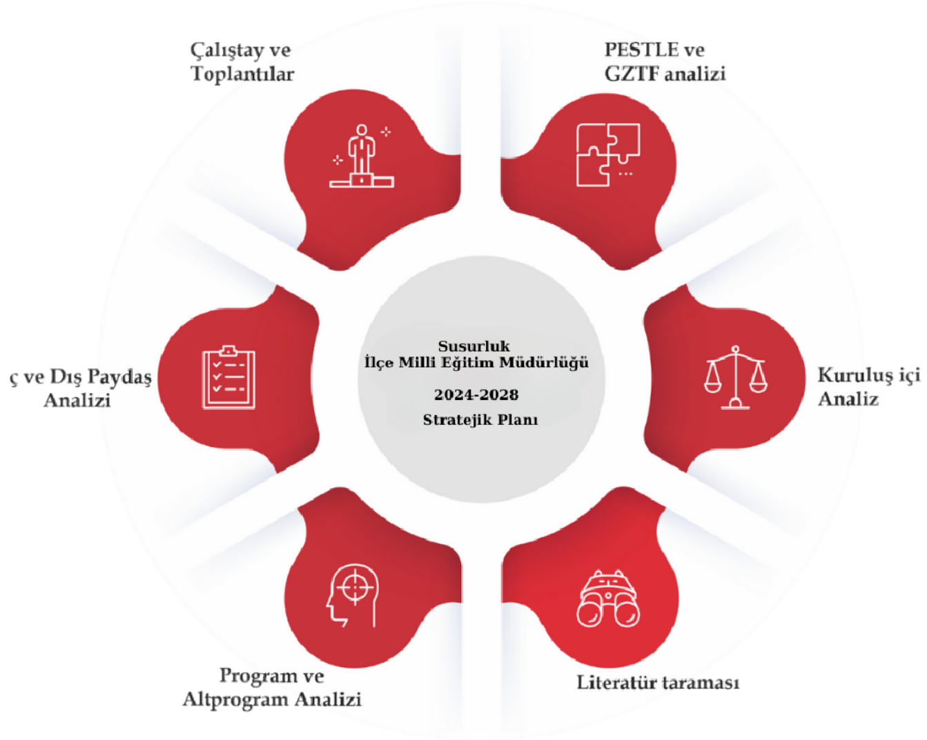
Şekil 1. Stratejik Plan Hazırlık Aşamaları